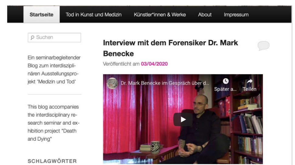
Interview mit dem Forensiker Dr. Mark Benecke für den Blog

Während dieser Arbeit entstanden nicht nur ein umfangreiches Begleitheft zur Ausstellung, sondern auch ein kurzer Film, der die gesamte Arbeit dokumentierte, sowie ein Experten-Interview mit dem bekannten Kölner Kriminalbiologen und Forensiker Dr. Mark Benecke über unterschiedliche Perspektiven auf und Umgangsweisen mit dem Tod in Kunst, Kultur, Medien und Biologie bzw. Medizin. Beide Videos sowie eine digitale Version des Ausstellungsheftes sind nach wie vor auf dem Blog einzusehen ( https://deathdying.hypotheses.org ). Im Sinne einer guten wissenschaftlichen Praxis wurde der seminarbegleitende Blog auf Hypotheses, dem nicht-kommerziellen Blogportal für die Geistes- und Sozialwissenschaften, eingebettet. Das deutschsprachige Portal wird von Open Edition in Zusammenarbeit mit der Max Weber Stiftung bereitgestellt.