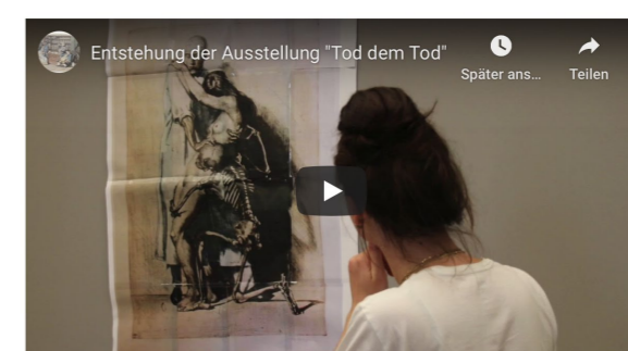
Video-Dokumentation des kuratorischen Prozesses