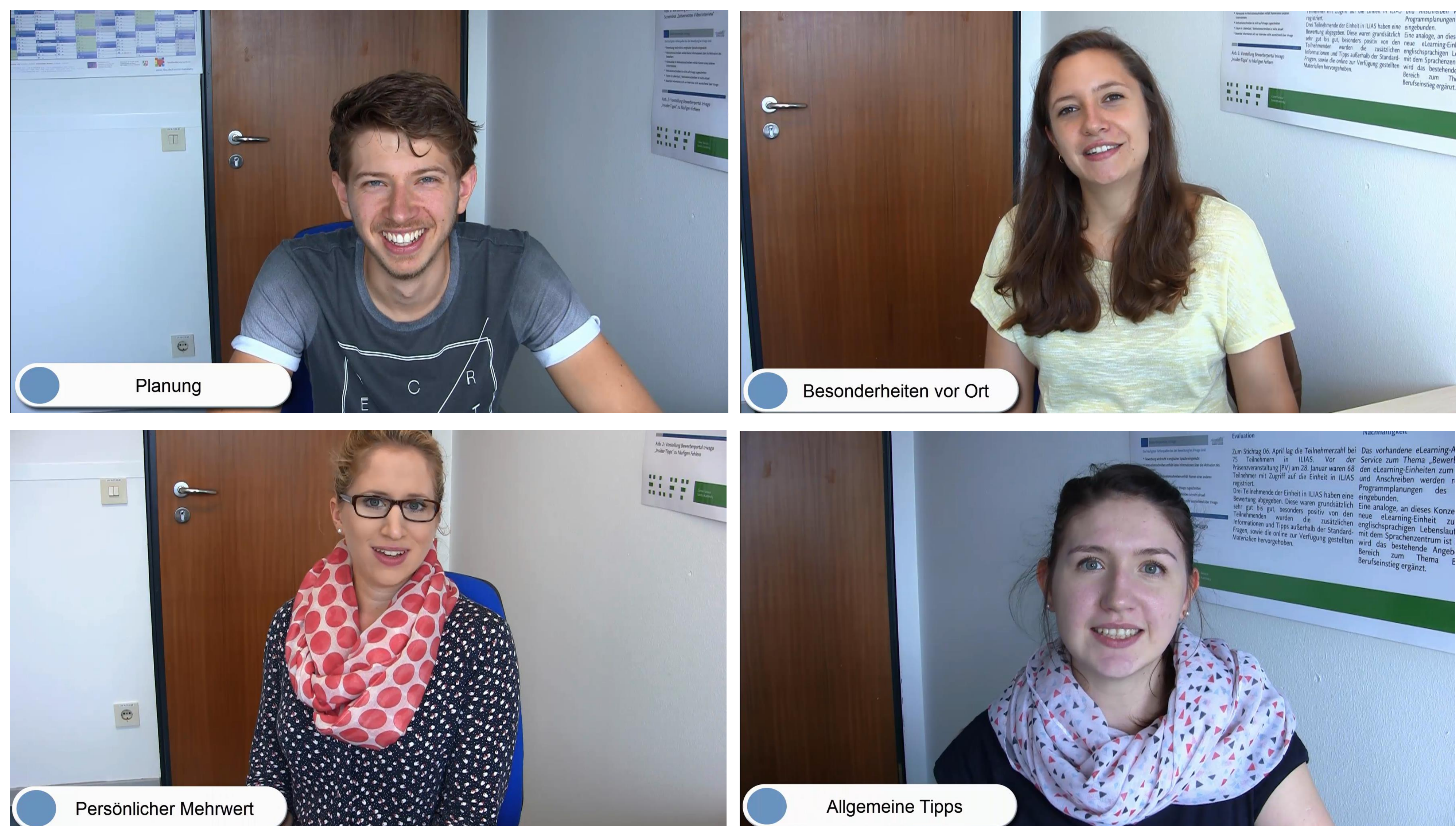
Abb. 2: Videoausschnitte aus den Erfahrungsberichten

Durch dieses eLearning-Angebot wurden zusätzliche Angebote geschaffen, welche die Studierenden effizient, zielführend und fundiert auf den – auch internationalen – Arbeitsmarkt vorbereiten.