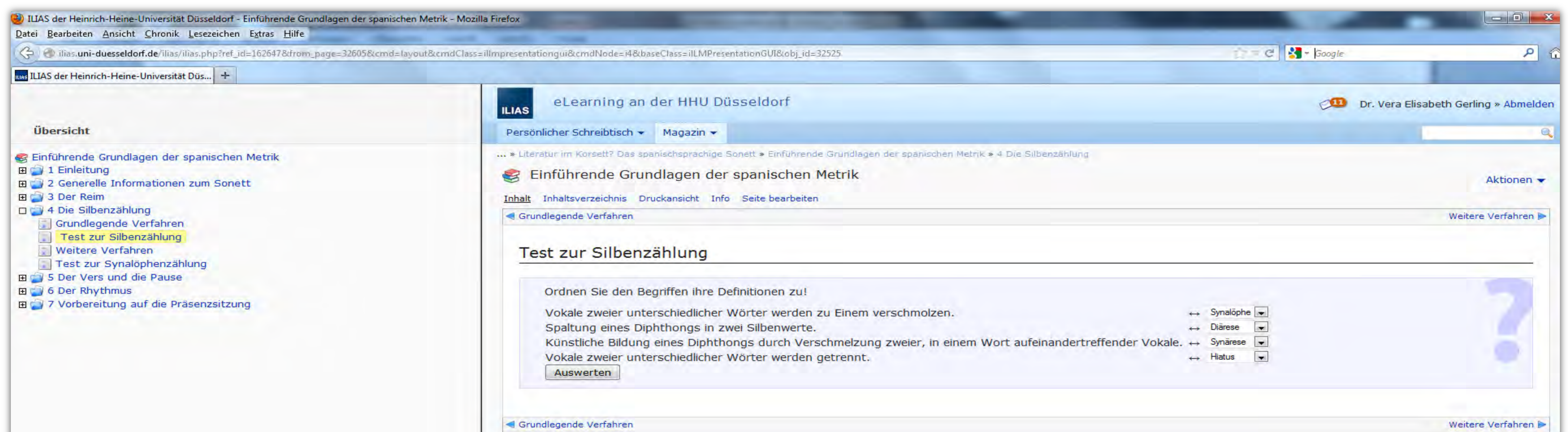
Multiple-Choice-Test zu Besonderheiten der spanischen Silbenzählung